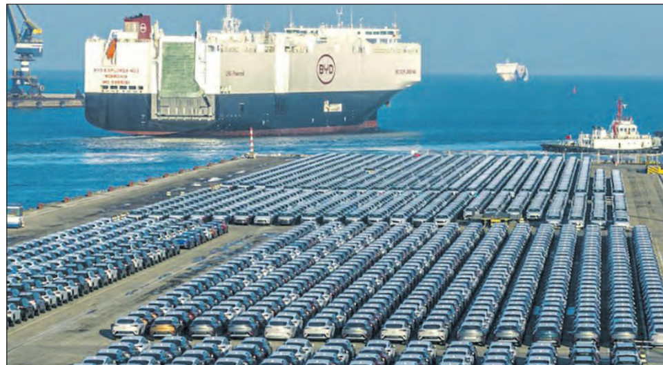
La importación de autos chinos reactivó la discusión sobre la competencia y la producción nacional

El ministro sostuvo que la apertura no res-