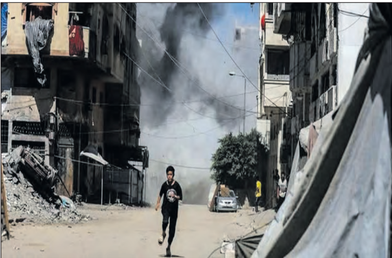
Un niño huye de un bombardeo en Gaza.

De acuerdo con el plan de 20 puntos elaborado por Washington, el enclave palestino será