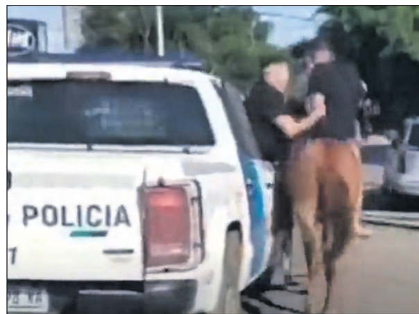
Momento en el que la policía baja a uno de los ladrones.

El operativo policial y posterior rescate de los animales fue destacado por un grupo de proteccionistas de caballos de Quilmes, quienes compartieron las imágenes en sus redes sociales y contaron el hecho a sus seguidores.