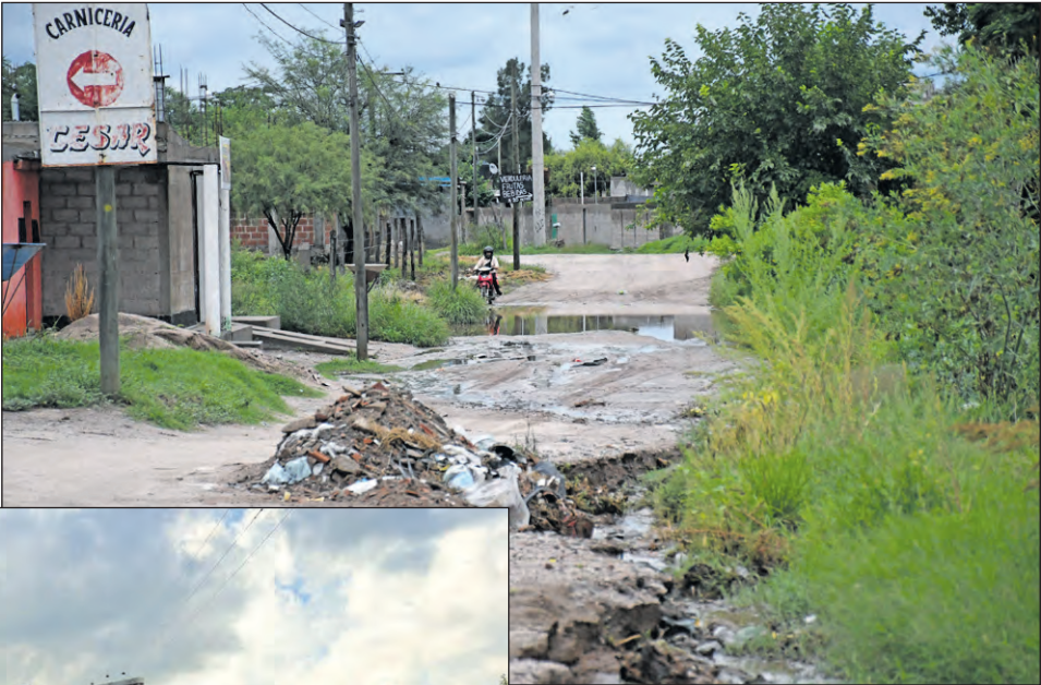
La cuestión de la pavimentación es un factor que no se resuelve en los barrios más alejados.

De acuerdo al escueto comunicado oficial “luego de declarar la emergencia vial, todos los equipos operativos del Municipio Capital están realizando tareas de bacheo y recuperación de