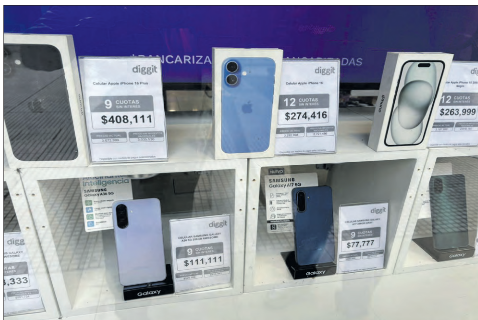
Mientras se aguarda la vigencia del arancel cero en esta Capital se ofrecerán celulares Iphone 15 y 16.

Medios El Independiente hizo un recorrido por las tiendas locales para averiguar sobre los precios de los celulares importados, en el caso particular