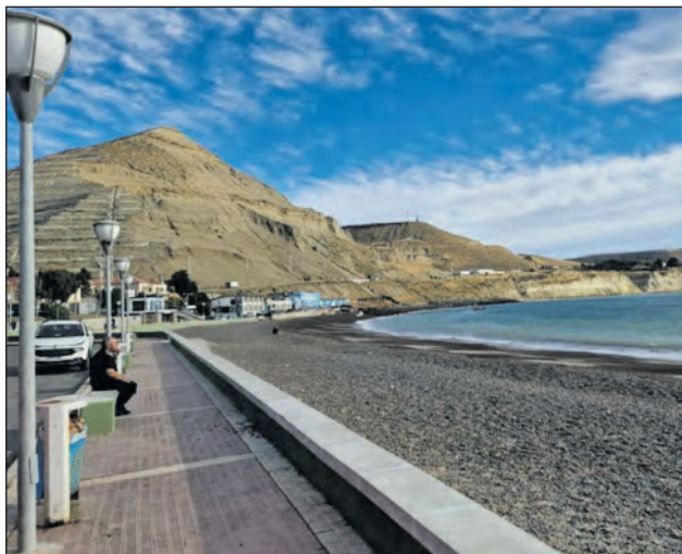
Comodoro Rivadavia y su costa, donde se habría producido el crimen.

El cuerpo de Valeria fue encontrado días atrás y tenía claros signos de violencia. Según indicaron fuentes policiales, estaba