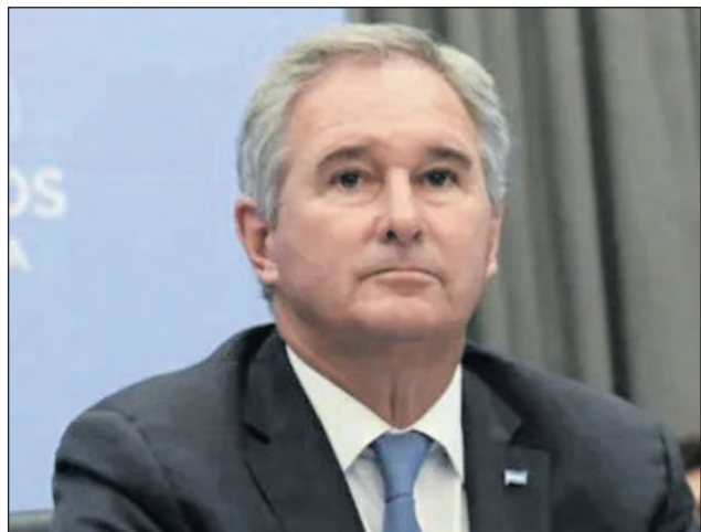
El canciller argentino Pablo Quirno

Recordar por último que los incendios en Chubut comenzaron a principios de enero y ya afectaron más de 20.000 hectáreas de territorio patagónico. Allí, un foco de fuego en el Parque Nacional Los Alerces todavía permanece activo y es combatido por 149 brigadistas, mientras que por el momento no se ha podido determinar el número de hectáreas afectadas.