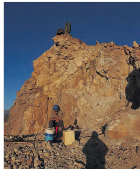
La denuncia de los trabajadores expone condiciones laborales de “extrema insalubridad”

de “extrema insalubridad y riesgo”. Según el relato de los trabajadores, consignado en la denuncia presentada por Borda, las tareas de extracción y molienda se realizaban sin protocolos de seguridad. En este sentido, se denunció que los operarios eran trasladados en cajas de camionetas y debían proveerse su propio alimento y agua en el yacimiento, ya que la empresa no garantizaba las condiciones mínimas de habitabilidad.