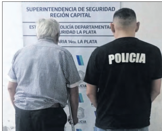
El jubilado detenido que portaba un arma lista para disparar.

Al grito de “Mamita te voy a partir toda”, más la incautación de un arma calibre 38 y balas aptas para el disparo, un jubilado de 78 años fue arrestado este viernes 16 de enero en La Plata, a causa de un conflicto entre vecinos que terminó en un tiroteo, todo ocurrió en el barrio de Melchor Romero.