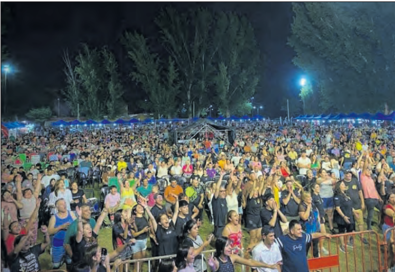
La Fiesta Provincial del Turismo recibirá a miles de visitantes.