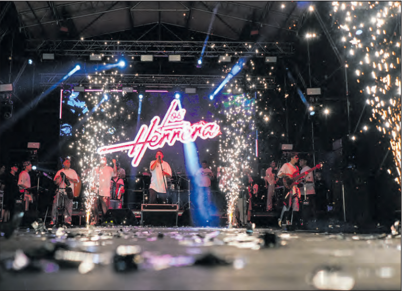
El cierre del Reencuentro estuvo a cargo de Los Herrera.

la noble identidad del Valle Sauceño. Los Sauces luce con imponente belleza tras las precipitaciones que resaltan aún más las bondades de las quebradas de Andolucas, Hualco, El Rincón, Suriyaco, Maican, Amuschina y Tuyubil así como el río Los Sauces.