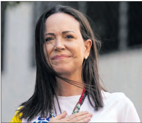
La líder opositora y Premio Nobel de la Paz, María Corina Machado.

La líder opositora y Premio Nobel de la Paz habló tras su encuentro con Trump de este jueves, expresando que buscaba reforzar lazos bilaterales y visibilizar el respaldo internacional a la causa venezolana y que espera ser elegida presidenta “en el momento adecuado”.