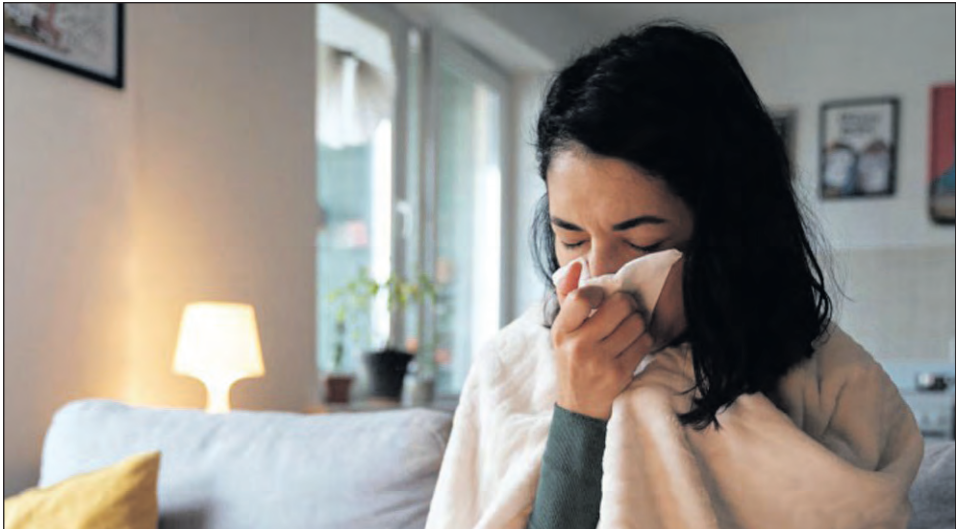
En caso de presentar síntomas compatibles con una infección respiratoria, evitar actividades sociales o turísticas.

La gripe H3N2 volvió a encender las alertas sanitarias en la provincia. En los últimos días, varios países de América Latina confirmaron casos del subclado K de la gripe A (H3N2), una variante que preocupa a los especialistas por su rápida expansión y su capacidad de evadir parcialmente la inmunidad previa. El caso riojano corresponde a una mujer de 41 años de edad, sin antecedentes de viaje al exterior. El cuadro clínico se inició el día 5 de enero, con síntomas compatibles con una enfermedad respiratoria aguda, tales como fiebre, cefalea, tos, odinofagia, congestión nasal y diarrea. El 6 de enero pasado se realizó el hisopado nasofaríngeo, cuyo resultado fue positivo para Influenza A. De acuerdo con los protocolos vigentes, la muestra fue derivada al Laboratorio Nacional de Referencia “Dr. Carlos G. Malbrán”, donde se confirmó, mediante estudios de caracterización genómica, que el agente etiológico corresponde a Influenza A (H3N2), subclado K. En este sentido, se informó que la paciente cursó la enfermedad de manera ambulatoria, con una evolución clínica favorable durante un período aproximado de seis días, recibiendo tratamiento sintomático y sin requerir inter-