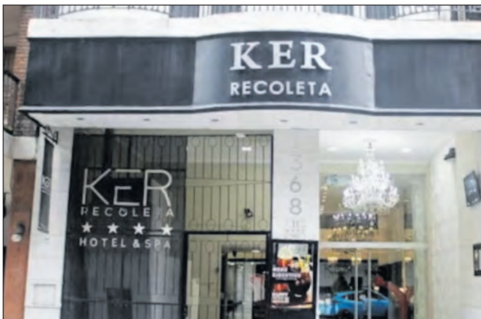
Hotel donde encontraron a la mujer y su hijo sin vida.

Según informaron fuentes policiales, el gerente del hotel avisó a la Policía de la Ciudad después de que el personal del establecimiento ingresó a la habitación al notar que la mujer y el niño no habían realizado el check-out en el horario previsto ni respondían a los llamados. Ambos se habían registrado el día anterior.