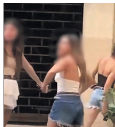
En el video difundido se ve a la joven haciendo gestos que fueron denunciados.

El caso quedó en manos de la 11ª Delegación Policial de Rocinha, que solicitó a la Justicia la retención del pasaporte de la joven argentina y la imposición de una tobillera electrónica para garantizar el cumplimiento de las medidas adoptadas. De