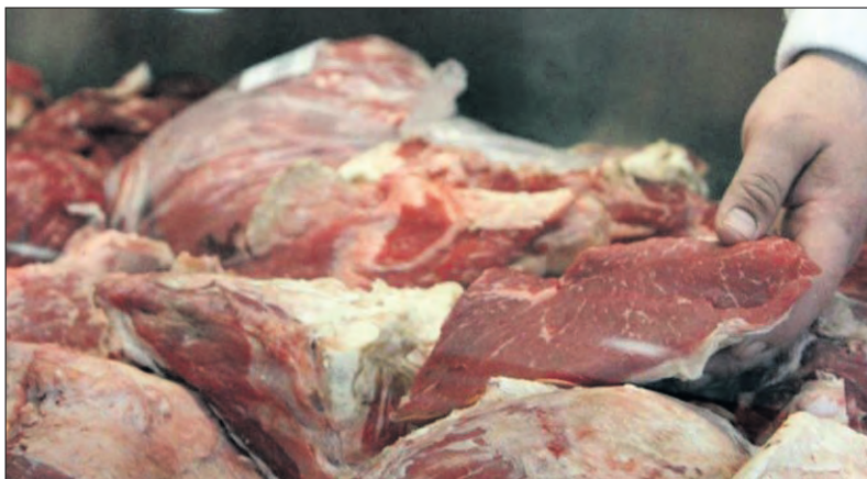
El bloque de alimentos que más subió en el año fue la carne vacuna.

El aumento de la Canasta Básica Alimentaria (CBA) registrado tanto por mediciones oficiales como privadas para el mes de diciembre se explicó, según la Fundación COLSECOR en una nueva suba de la carne vacuna, en promedio un 9,5% mensual. Otro porcentaje corresponde al aumento estacional de la papa, la manzana y la pera.