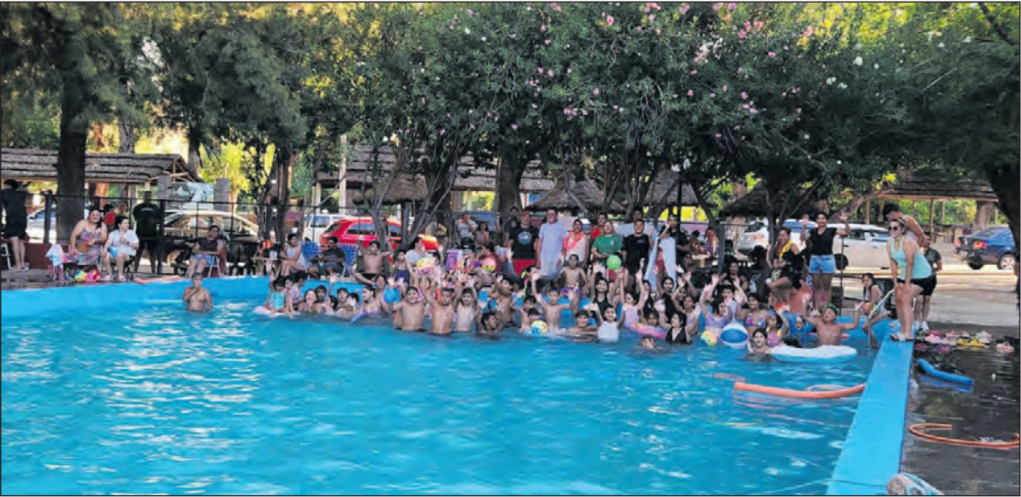
Los niños disfrutando de la colonia en el camping de Andolucas.

El Camping Municipal de Andolucas se transformó en el escenario de una tarde inolvidable. En el marco de la agenda de verano impulsada por la Municipalidad, más de 130 niños y niñas de la zona participaron de una colorida “Pool Party”. La iniciativa no solo buscó ofrecer un espacio de esparcimiento frente a las altas temperaturas, sino también fortalecer los vínculos comunitarios entre las familias sauceñas y los visitantes que eligen la localidad. La organización del evento fue el resultado de un trabajo coordinado y transversal entre las direcciones municipales de Deportes, Juventud y Turismo. Esta alianza estratégica permitió que la logística cubriera todos los frentes, desde la seguridad recreativa hasta el entretenimiento cultural. Durante toda la tarde, los pequeños disfrutaron de juegos acuáticos dirigidos y música ambiente, complementados con un servicio de refrigerios que incluyó licuados de frutas y una mesa dulce especialmente preparada para la ocasión. Un punto fundamental para la tranquilidad de los padres fue la presencia constante del equipo de guardavidas municipales. Los profesionales supervisaron cada actividad dentro y fuera del agua, garantizando que el entorno fuera seguro en todo momento. Esta atención al detalle refleja el compromiso de la gestión local por ofrecer propuestas de calidad que cumplan con los estándares de seguridad necesarios para eventos de gran convocatoria infantil. El broche de oro de la jornada llegó con la presentación del