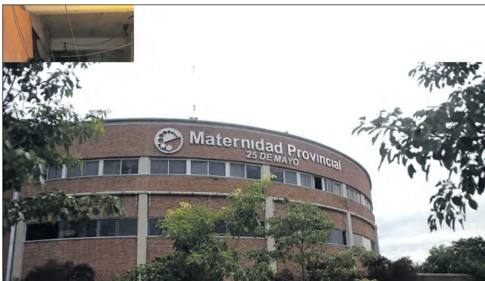
El edificio de la maternidad provincial 25 de mayo de Catamarca