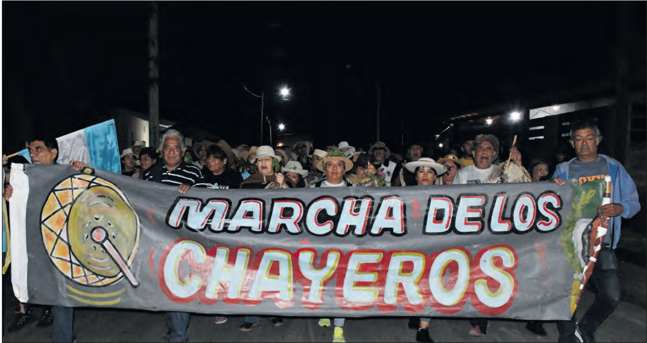
Los chayeros sanagasteños se sumaron a la gran marcha festivalera en la noche apertura.

*Buena organización para el ingreso del público, músicos y prensa a los sectores correspondientes. Excelente predisposición del personal para marcar y orientar a los lugares respectivos. *El viaje hacia la localidad, tanto la ida como el regreso fue de manera ordenada y respetuosa por parte de automovilistas, motociclistas y conductores de rodados mayores. Siempre bajo el resguardo preventivo del personal policial, municipal y de Seguridad Vial en cada posta instalada a lo largo de la ruta. *Mucha presencia de vendedores ambulantes de comidas y bebidas en lugares aledaños al predio. Se podía conseguir desde empanadas, pebetes, sándwich de milanesas, gaseosas, vinos, espuma, harina, tortas, helados, indumentaria, productos regionales caseros entre otros. *Más de 200 efectivos de seguridad se designaron para brindar la mayor tranquilidad a espectadores, vecinos y visitantes, antes, durante y posterior al evento. *Excelente el servicio de baños químicos. Buena cantidad e higiene. Se brindaba papel higiénico en caso de solicitarlo. *Mucho material descartable de bebidas o vasos arrojados en el suelo del predio. Por momentos se dificultaba caminar por los sectores. Sería importante contar con varios cestos y concientizar al público sobre el aseo y el reciclaje.