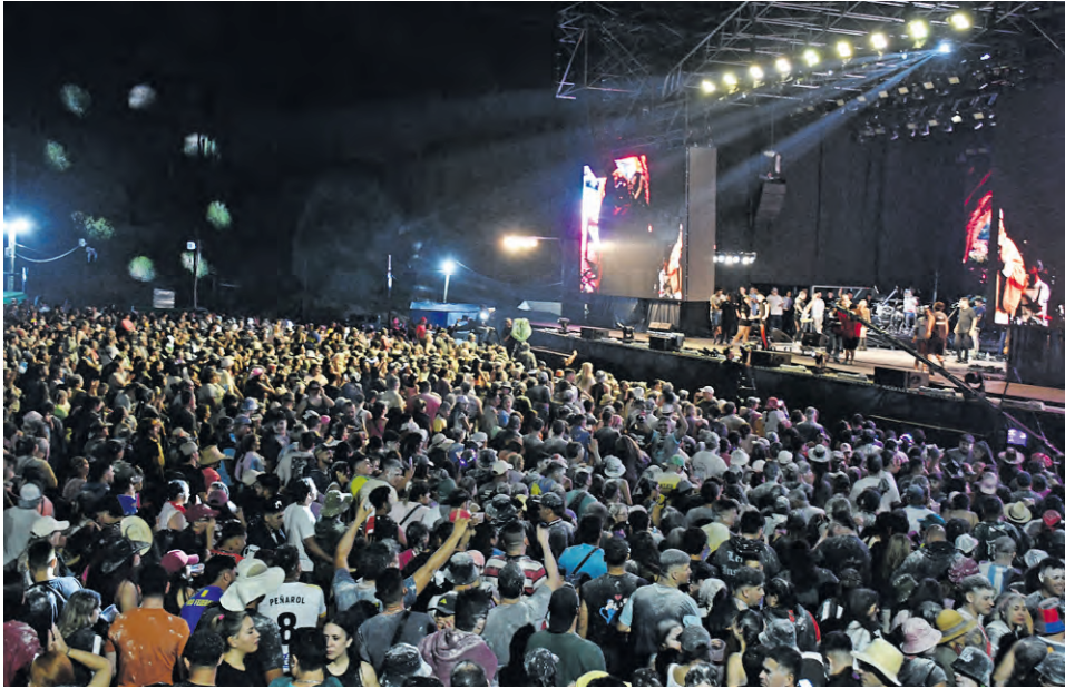
El Anfiteatro "Alfonso 'Tilo' Romero" se mostró con su capacidad totalmente colmada en su primera noche chayera.