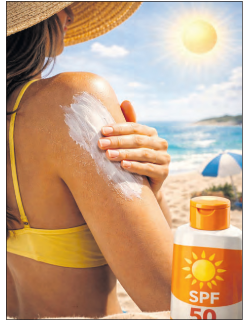
El protector solar un gran aliado en tiempos de verano y del sol riojano.

Los rayos UVB también estimulan la producción irregular de pigmentos en la epidermis, lo que produce manchas oscuras (también conocidas como manchas de la vejez) y una tez amarillenta. En general, estos cambios en la piel se conocen como fotoenvejecimiento.