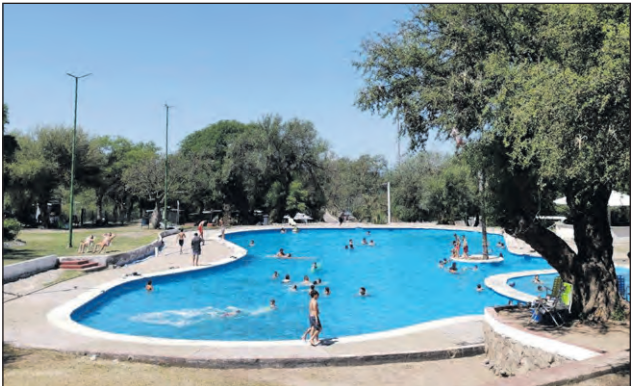
El complejo totalmente renovado y que albergará a cientos de personas este verano.

Esta medida busca transformar el complejo en una verdadera vitrina de la producción local, desde artesanías hasta gastronomía regional, dinamizando la economía de las familias del departamento.