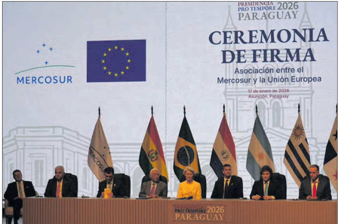
El momento de la firma del acuerdo con los mandatarios del Mercosur y representantes de la UE.

Pese a estar presentes los presidentes, la firma fue hecha por los cancilleres del Mercosur, Rubén Ramírez Lezcano (Paraguay), Pablo Quirno (Argentina), Mauro Vieira (Brasil), Fernando Aramayo (Bolivia), Mario Lubetkin (Uruguay) y Javier Martínez-Acha. Por parte de la Unión Europea, la firma recayó en el comisario de Comercio, Maro efovi. Esta modalidad de la ceremonia la decidió semanas atrás Paraguay debido a que, en el caso de la UE, los firmantes formales son los ministros.