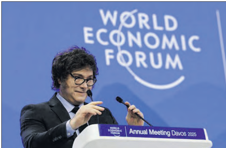
Milei volverá a hablar en Davos.

De acuerdo con lo que precisaron fuentes oficiales, el mandatario argentino partió rumbo a la ciudad suiza ayer a las 21:00, acompañado por su secretaria general, Karina Milei, y los ministros de Relaciones Exteriores, Pablo Quirno; de Economía, Luis Caputo, y de Desregulación y Transformación del Estado, Federico Sturzenegger.