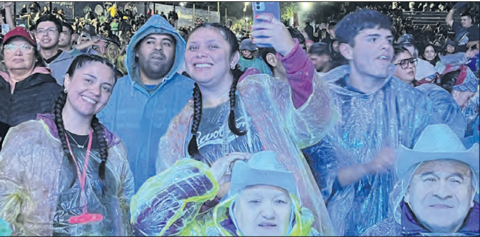
A pesar de la intensa lluvia chayeros se las ingeniaron y tuvieron tiempo para sacarse una foto.

dificaron portones para mejorar la accesibilidad a la gente”.