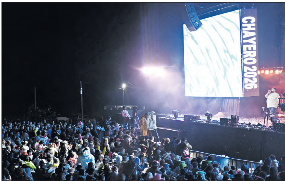
La lluvia no fue un impedimento para cortar la alegría y la fiesta de los chayeros en el Anfiteatro "Alfonso 'Tilo' Romero".

Todas las expectativas estaban puestas en la llegada del grupo cordobés la LBC y la presencia