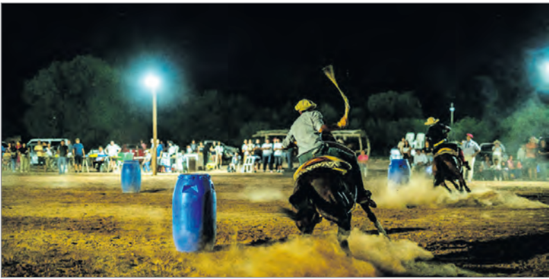
Los gauchos y sus destrezas fueron uno de los puntos fuertes después de la celebración religiosa.

có para disfrutar de un programa cargado de identidad desde las clásicas destrezas gauchescas que pusieron a prueba la habilidad de los jinetes, con los clásicos juegos que fueron parte de la historia de los llanos, y hasta la oferta gastronómica de comidas típicas que acompañó la velada. La jornada contó con un fuerte componente político e institucional. La presencia del jefe comunal no fue protocolar. Durante la noche, la organización le entregó un reconocimiento, destacando el apoyo del municipio a las iniciativas que buscan preservar el acervo cultural de la región.