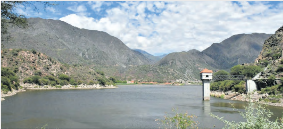
Scaglioni detalló que, aproximadamente, los diques acumularon 48 centímetros de agua entre la primera y última lluvia.

Además, destacó que “esto es importante, al dique ‘Los Sauces’ le entraron 38 centímetros durante la primera tormenta, 10 en la última y