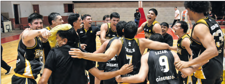
El desahogo desaforado final, tras padecer el partido, correr de atrás, y sentir que no alcanzaba. El triunfo valió y se festejo como un título.