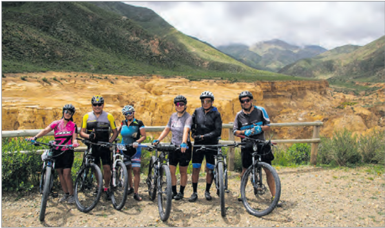
Ciclistas tomándose una foto, con el cañón del ocre de fondo

La gestión municipal organizó un evento de cicloturismo y enduro que convocó a deportistas de toda la región. La importancia de combinar naturaleza y turismo para poner en valor los paisajes únicos del departamento y dinamizar la economía en plena temporada. Famatina ratificó su estrategia de posicionamiento turístico con una apuesta fuerte a los deportes de montaña. En una movida que busca capitalizar los atractivos naturales del oeste riojano, se organizó una travesía de cicloturismo y enduro turismo que tuvo como destino final el imponente Cañón del Ocre, una de las joyas geográficas de la provincia. Desde la gestión municipal enfatizaron que “continuamos trabajando de manera sostenida para impulsar iniciativas que promuevan el turismo activo”, lo que da la premisa del entendi-