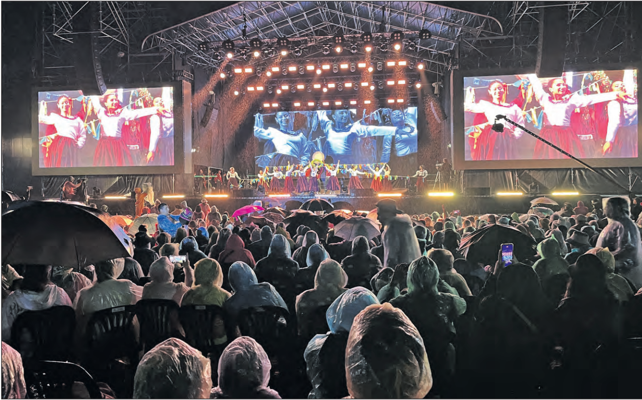
El Ballet Oficial del Chayero Sanagasteño también brilló con sus pases mágicos en medio del agua.

“Este es un festival -agregó- que cada año tiene una vara que hay que subirla y superarla. Cada año se ve en los detalles que se pueden mejorar. Este año se amoldaron baños en la zona de la platea, se mo-