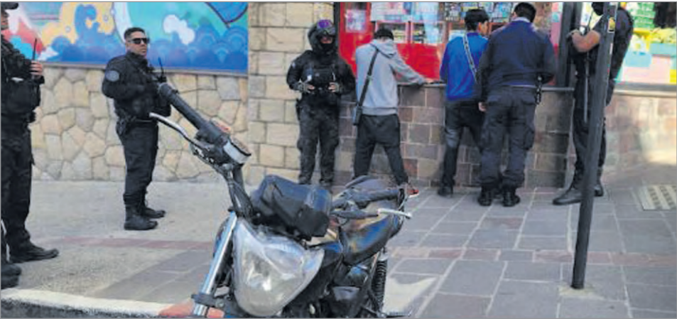
Llevaban envoltorios de cocaína y marihuana para vender.