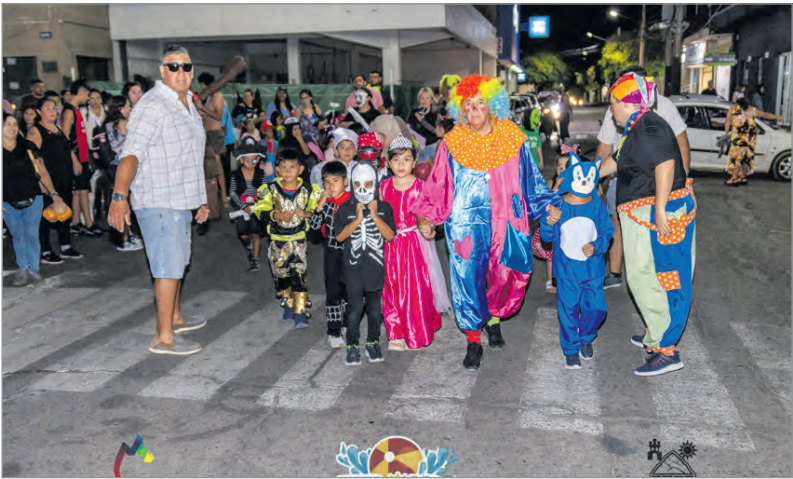
Niños junto a sus profesores y padres en el centro de la ciudad de Chilecito.

Como cada año, el municipio del departamento Chilecito anunció el comienzo de las colonias de verano con un mensaje que decía “en nuestra Colonia Municipal de Verano, se vivió el último día de la temporada 2025/2026 con el tradicional desfile de Disfraces en Plaza Principal “Caudillos Federales”. Celebraron la imaginación y la creatividad de cada niño que iluminó cada rincón del centro de la ciudad y que tuvieron su cierre con el baile final en las instalaciones del Polideportivo Martín Spallanzani. Una noche llena de risas, música, energía pura y emoción. En sus redes sociales dejaron un mensaje cargado de emoción y alegría tanto para las