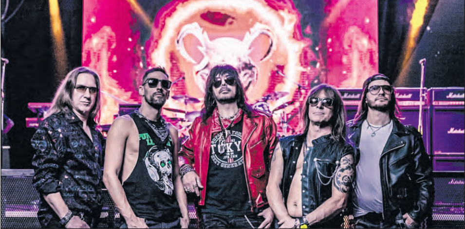
El recital en La Rioja propondrá un recorrido por distintos momentos de la historia musical de la banda, con foco en las composiciones del disco homenajeado. Las entradas se encuentran disponibles a través de EntradaWeb.

rock con estructuras melódicas influenciadas por la música clásica, Rata Blanca logró integrar nuevas audiencias y consolidar su perfil artístico. Durante su trayectoria, también fue ubicada dentro de diversos subgéneros del metal, aunque el grupo prefiere definirse simplemente como "rock metálico". A lo largo de su carrera, Rata Blanca acumuló varios reconocimientos y se convirtió en una de las agrupaciones argentinas de mayor proyección regional. Tres de sus discos han sido incluidos entre los 250 más destacados del rock iberoamericano, mientras que "Magos, Espadas y Rosas" superó los cinco millones de copias vendidas, según datos difundidos por la producción del grupo. Parte de su popularidad se vinculó al estilo virtuoso de Giardino y al registro vocal de Adrián Barilari, combinación que se consolidó como sello del conjunto.