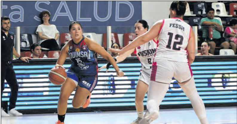
En Santiago del Estero, Quimsa fue mejor, y las chicas de “La Fusion” no pudieron ganar